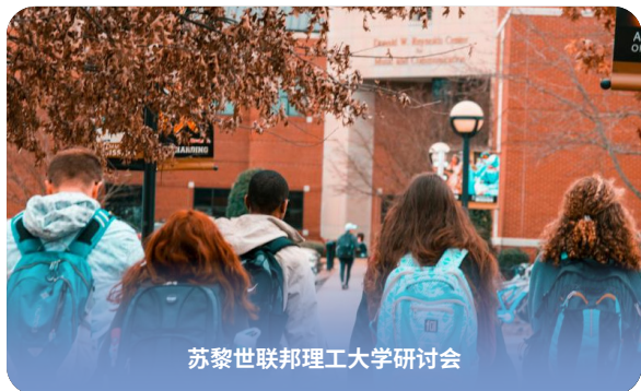
苏黎世联邦理工大学研讨会

体育与健康合作： 与体育俱乐部和健康中心的合作为学生提供参与体育活动、学习健康和健身知识以及培养均衡生活方式的机会。这些合作加强了学校与社会的联系，丰富了学术和课外活动。