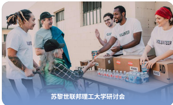
苏黎世联邦理工大学研讨会

丰富的创意活动： 展览和冬季舞会等活动为学生提供了一个表达创造力的平台，同时承担组织和实施的责任。