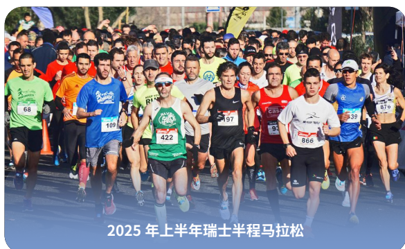
2025 年上半年瑞士半程马拉松

体育领域的合作伙伴关系： 与体育俱乐部和专业提供商的合作将提供额外的机会，例如特殊课程和锦标赛。