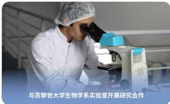
与苏黎世大学生物学系实验室开展研究合作