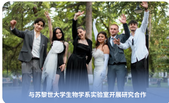
与苏黎世大学生物学系实验室开展研究合作