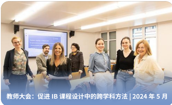
教师大会：促进 IB 课程设计中的跨学科方法 | 2024 年 5 月

在 Academic Gateway，我们组织重要的学校活动，以增强我们的社区意识，并标记学生学术旅程中的重要里程碑。如学期开学、毕业典礼和教师大会等活动将学生、教师和家长聚集在一起，营造一种支持和包容的文化。这些活动不仅庆祝学术成就，还促进了符合 IB 理念的宝贵互动，营造了协作的教育氛围。