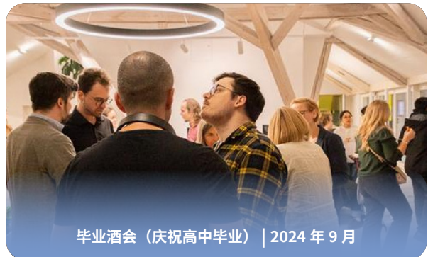
毕业酒会（庆祝高中毕业） | 2024 年 9 月