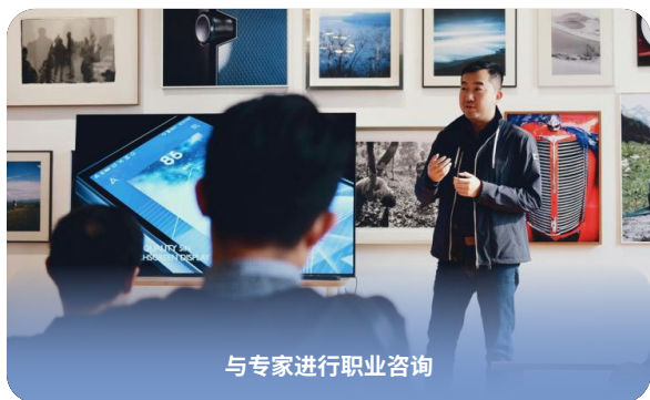
与专家进行职业咨询

职业展览会和晚间活动： 与商业和科学专家一起参加职业展览会和晚间活动为学生提供实用的视角并帮助他们发展职业兴趣。